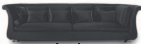
Perception Grandiose 4 zitter ook verkrijgbaar als hoek design

Vele modellen uit voorraad leverbaar! Bezoek onze toonzaal voor nog meer meubelair!