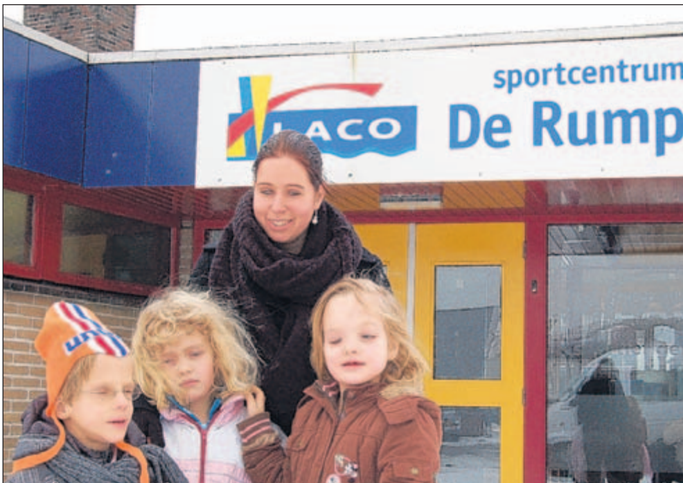
De leerlingen van De Starsprong krijgen nu nog zwemles in De Rumpst in Bunnik.