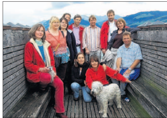
Het internationale Werbeck Ensemble zoekt het hogerop. Dus komen de zangers naar Zutphen.